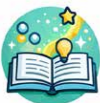
Educativo e moderno