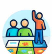
Singolo o gruppo