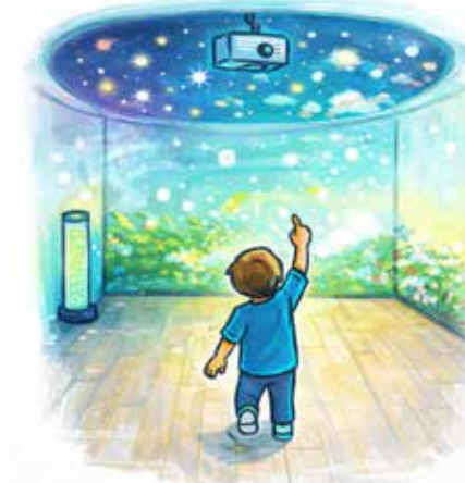
Proiezione parete + soffitto

La soluzione SENSEi può essere configurata in due modalità differenti, pensate per adattarsi agli spazi disponibili e agli obiettivi educativi della scuola. La configurazione con proiezione a parete e pavimento crea un ambiente altamente interattivo, in cui i bambini possono muoversi, esplorare e vedere il pavimento reagire ai loro gesti, mentre la parete diventa uno scenario coinvolgente da vivere e attraversare. La configurazione con proiezione a parete e soffitto, invece, privilegia un'esperienza più immersiva e rilassante: la parete accompagna l'attività con immagini e ambientazioni, mentre il soffitto si trasforma in un cielo di luci, stelle, bolle e colori che favoriscono calma, concentrazione e benessere emotivo.