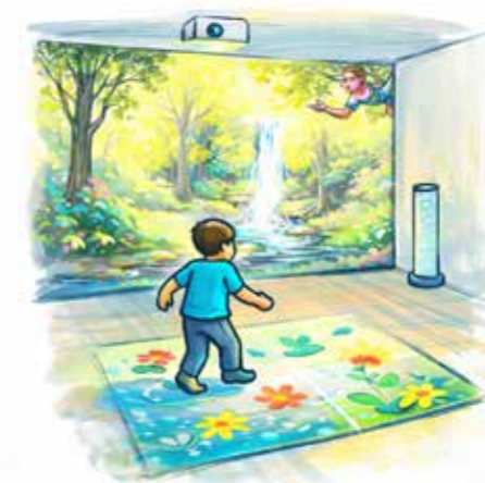
Proiezione parete + pavimento