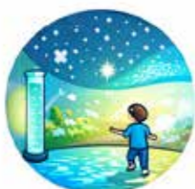
Reattivo e dinamico